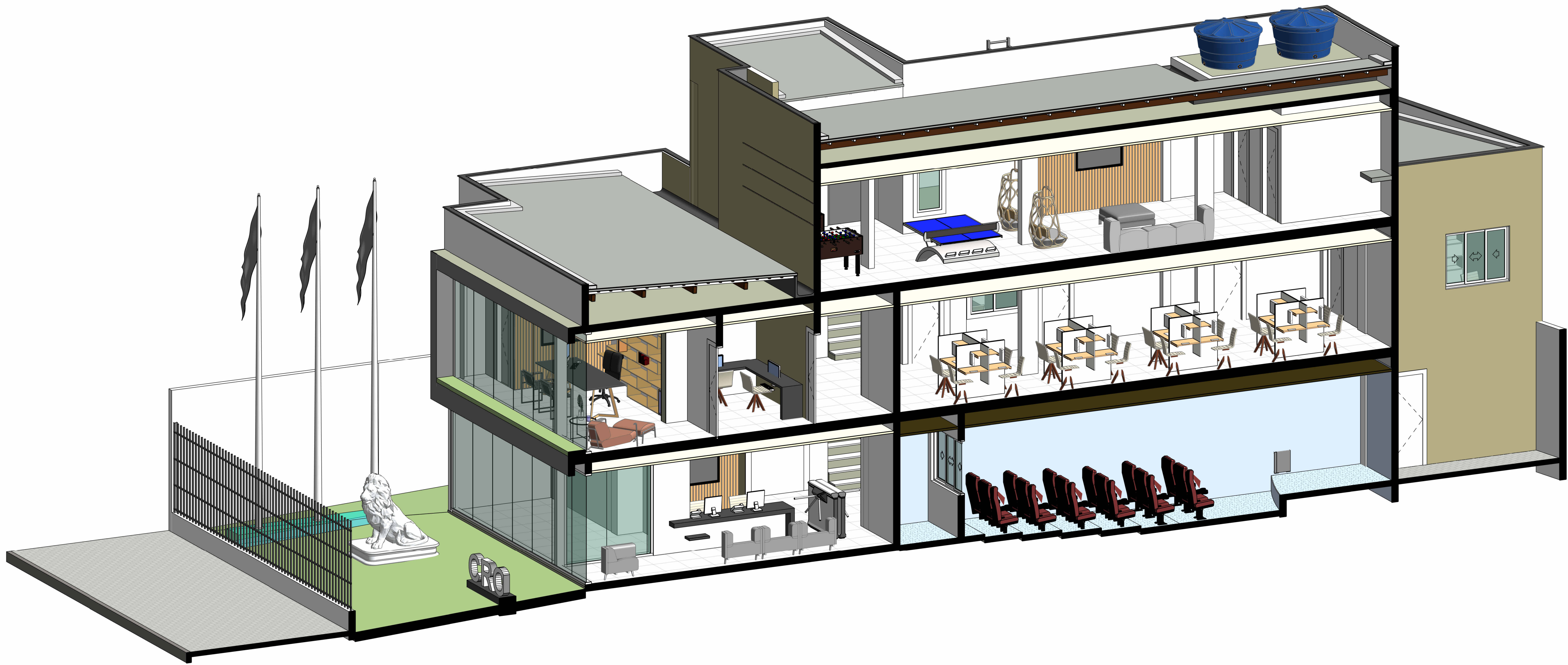
2 4. CORTE B2 EM PERSPECTIVA ESCALA -