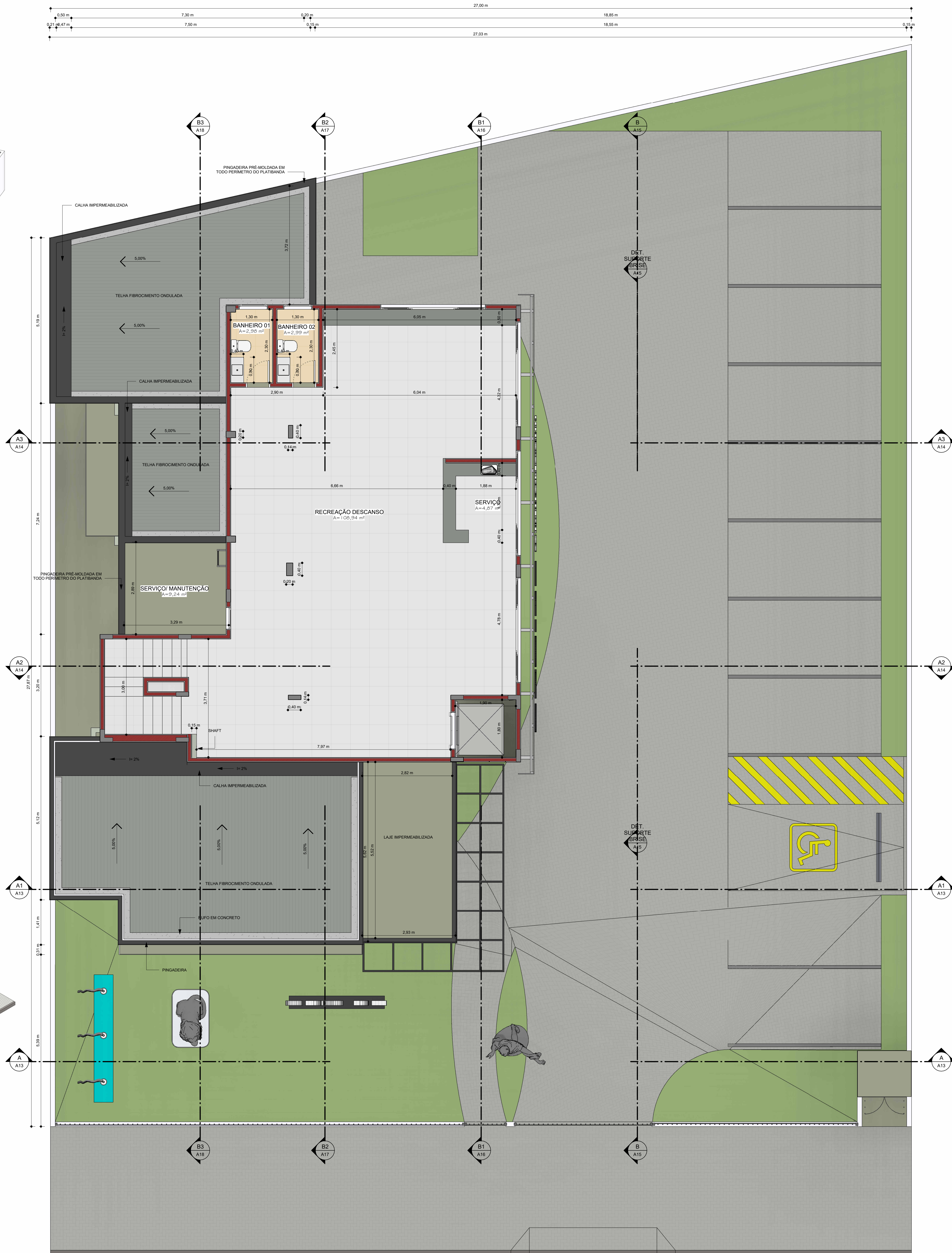
1. CONSTRUÇÃO - 2 PAVIMENTO ESCALA - 1 : 50